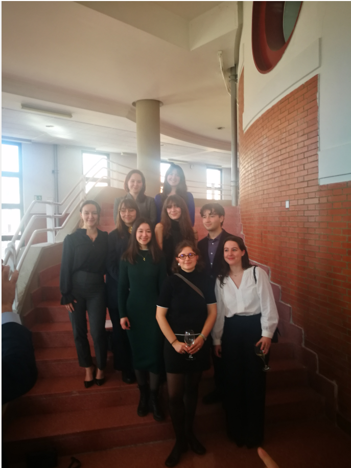
Summer School 2025

FORMATIONS : DROIT • SCIENCES POLITIQUES ÉCONOMIE • GESTION • INFORMATION - COMMUNICATION